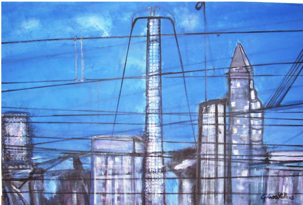
Caos elettrico (120 x 80)

Osservare le tele. Soprattutto coglierne la quiete, come a dire la benefica aura di pace che vi aleggia. E quei colori intensi e vibranti ma pur morbidi e concilianti: come a lontanare ogni intrusione del reale, ogni pericolo d'insurrezione esistenziale. Quei grattacieli, e porti e ponti ed arsenali; e quelle stazioni ferroviarie e fabbriche, di per sé simboli universali d'una vita dai ritmi arroventati e di un progresso alienante che riduce l'uomo a guardiano della propria follia, questi simboli nella pittura di Giulietta Cavallotti si trasformano in una sorta di memoria remota e nebulosa. Vale a dire: non più l'angoscia della contemporaneità, non più l'incombente frenesia della società la cui meta si chiama "successo" e "ricchezza". Quei "materiali" pittorici sono invece resi mansueti e inoffensivi: fratelli della nostra profonda esigenza di purezza e armonia. La Cavallotti sa magicamente elevare l'infuocato caos del vivere ad una natura dolce e immacolata: ad un paesaggio dell'anima nel quale i temibili oggetti sopra citati si son fatti innocenze e giocattoli: idonei a fungere da grati balsami del cuore. Lo sguardo è trasognato, come nella "Facciata romanica"; il disegno senza alcuna asperità quand'anche inteso alla spietatezza del riferimento, come ne "La gru rossa"; il dialogo fra i colori sempre presieduto da una vereconda concordia, come ne "La cattedrale del consumismo".