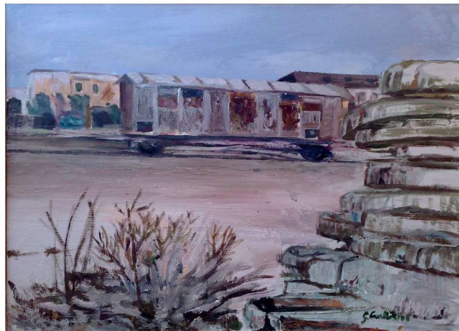
Stazione abbandonata (126 x 95)