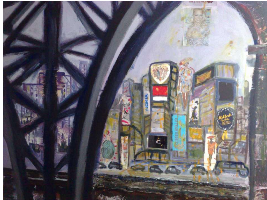
La cattedrale del consumismo tecnica mista su tela (120 x 100)