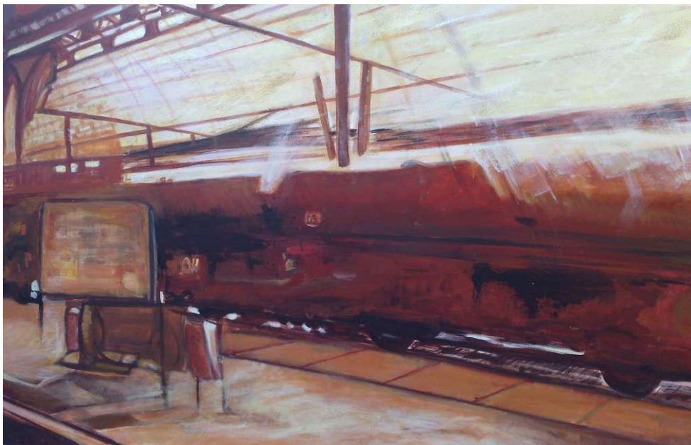
Stazione olandese (120 x 80)